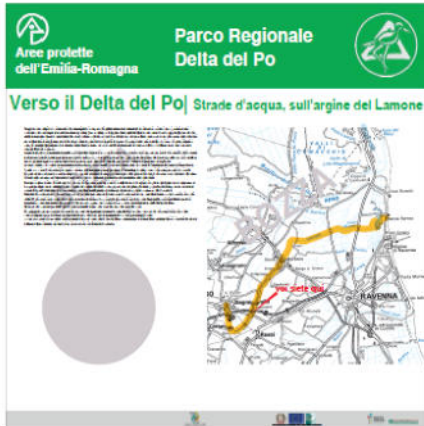
Pannello LATO 'A'