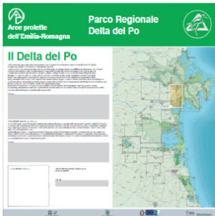
Pannello LATO 'B'