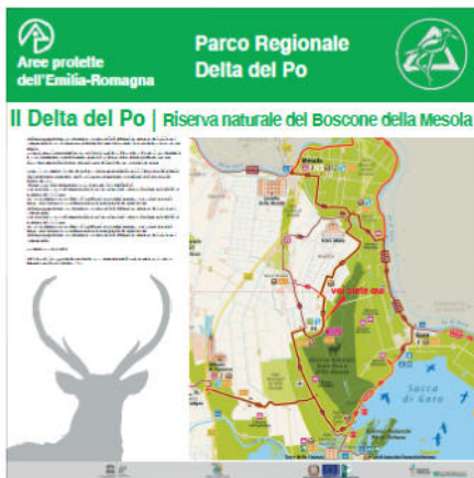
Pannello LATO 'A'

Allegato F- Fac-simile cartellonistica informativa da realizzarsi sulla base dell'immagine coordinata in corso di definizione da parte dell'Ente per la gestione dei parchi e delle aree protette – Delta del Po