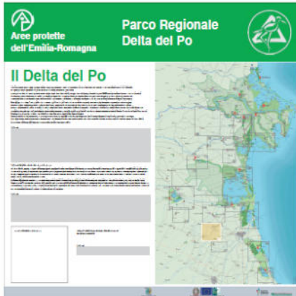
Pannello LATO 'B'