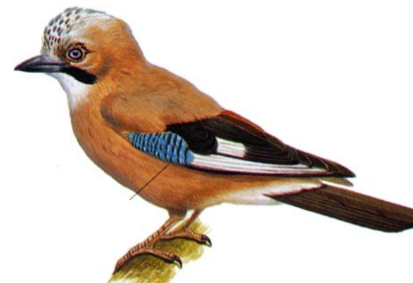
Tabella 1.2 - Uccelli di altre specie esaminati nell'ambito del piano di monitoraggio WND nella fauna selvatica. 2010