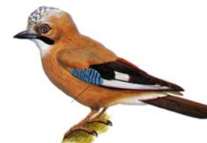
Tabella 1.2 - Uccelli di altre specie esaminati nell’ambito del piano di monitoraggio WND nella fauna selvatica. 2011