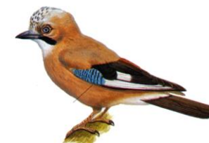
Tabella 1.2 - Uccelli di altre specie esaminati nell'ambito del piano di monitoraggio WND nella fauna selvatica. 2013

Esiti disponibili su uccelli prelevati fino al 07/08/2013