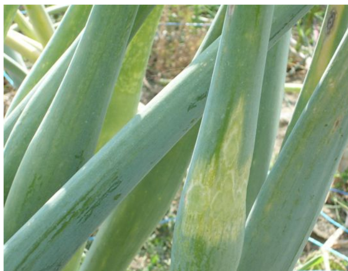
Scapo fiorale con aree cloro-necrotiche romboidali.