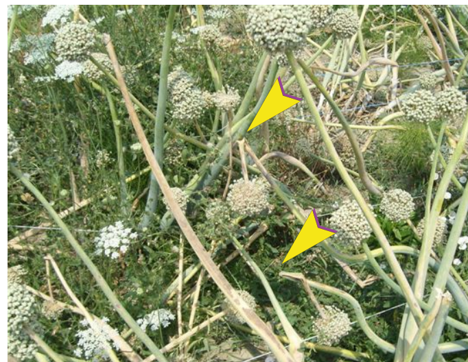
Scapi fiorali con necrosi e ripiegamenti verso il basso.