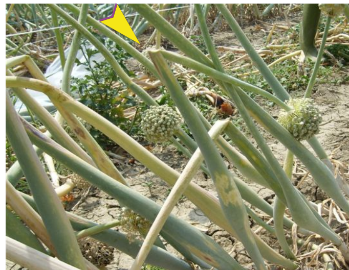
Sintomi necrotici nelle parti basali degli scapi fiorali e ripiegamento in corrispondenza dell'area con necrosi più accentuata.

In Italia la produzione di seme, spesso destinato all'esportazione, è economicamente importante. Il trasferimento di bulbi, utilizzati per il trapianto nel secondo anno del ciclo colturale, potrebbe causare la diffusione spaziale del virus in aree esenti ed arrecare danni di una certa importanza con riduzioni significative della produzione di seme.