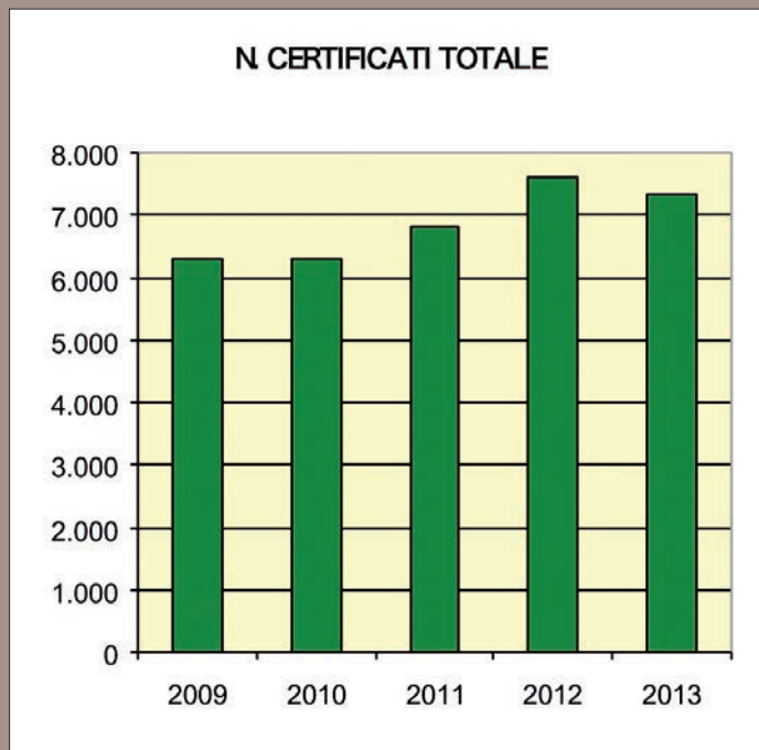
GRAF. 1 - CERTIFICATI EMESSI DAL SERVIZIO FITOSANITARIO DELLA REGIONE EMILIA-ROMAGNA NEL PERIODO 2009-2013

che in questo periodo di tempo molti Paesi sono entrati a far parte dell'Unione europea e che l'esportazione verso tali Paesi non richiede più l'emissione dei certificati fitosanitari, si comprende quanto sia aumentata l'esportazione verso nuovi mercati, principalmente Russia, Asia e Nord America. ■