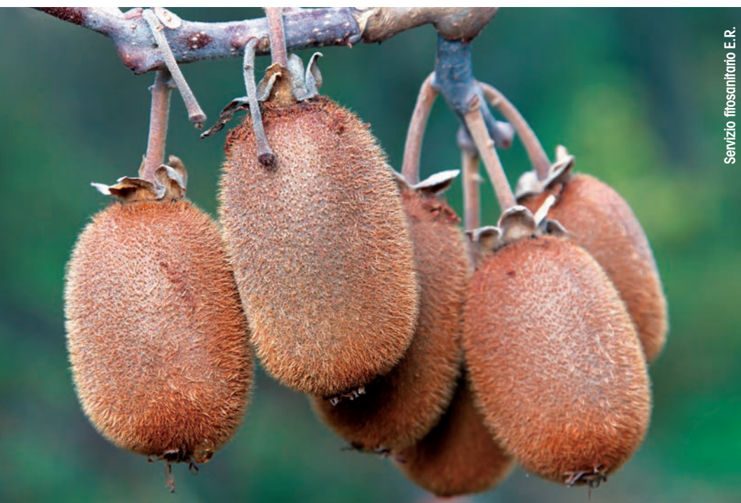
Servizio fitosanitario E.R.

Se anche uno solo degli organismi nocivi vietati in Corea, perché considerati da quarantena, viene individuato durante il controllo,