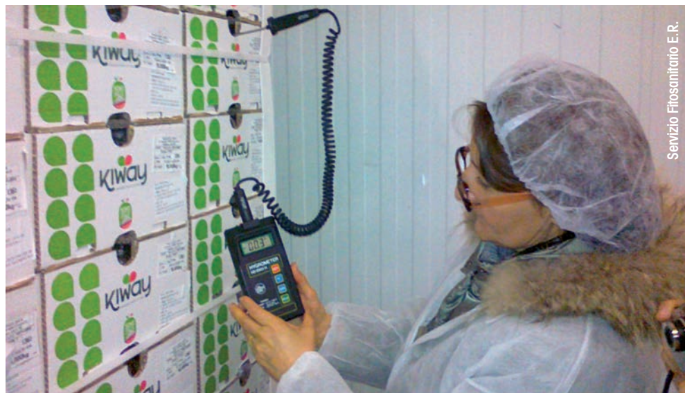
Servizio Fitosanitario E.R.

Un'attività altrettanto impegnativa è stata quella relativa all'esportazione di pere Abate Fetél