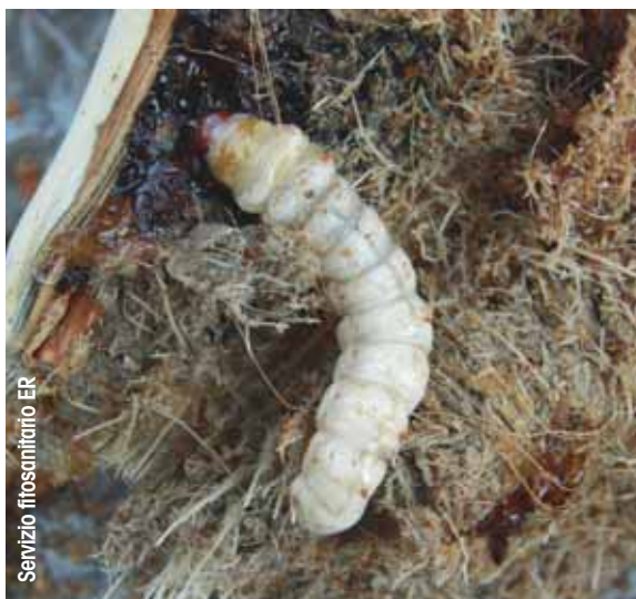
Larva di Paysandisia

La Paysandisia è un grosso lepidottero originario del Sud America, dove vive su palme spontanee. Il danno diretto è determinato dalle larve, che per nutrirsi scavano gallerie all'interno delle foglie e del fusto delle palme. Spesso le piante infestate non mostrano sintomi caratteristici, ma un generale deperimento, con diffusi ingiallimenti fogliari. Il danno può essere più o meno grave in funzione della specie colpita, dell'età della pianta e delle sue condizioni di sviluppo. L'insetto compie generalmente una generazione all'anno. Gli adulti sfarfallano in estate, da