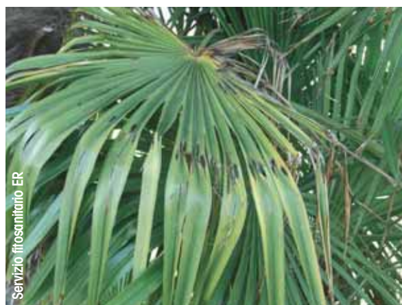
Erosioni su foglie di palma provocate da larve di Paysandisia archon

In considerazione della pericolosità dell'insetto è fondamentale la collaborazione di amministrazioni comunali, privati, vivaisti per un efficace controllo del territorio. Per questo sul portale della Regione, nelle pagine dedicate alle avversità delle piante, è disponibile una scheda di