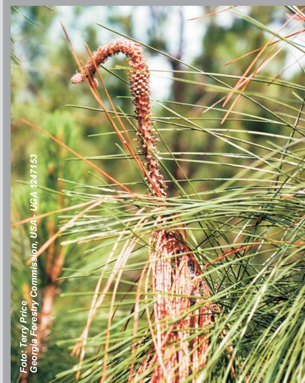
Fig. 6 - Disseccamento dell'apice di una giovane pianta di pino