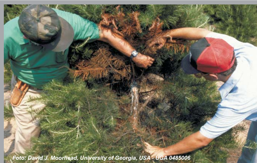
Fig. 7 - Le misure fitosanitarie adottate prevedono la pronta eliminazione delle piante infette

Poiché diversi altri fattori, sia biotici che abiotici, possono concorrere a causare essiccamenti della chioma simili a quelli causati da Gibberella , per una esatta determinazione dell'agente causale è necessario eseguire analisi di laboratorio. Allo scopo di prevenire l'introduzione e la diffusione di questo pericoloso patogeno si raccomanda di contattare il Servizio fitosanitario regionale in tutti i casi di sospetta presenza della malattia.