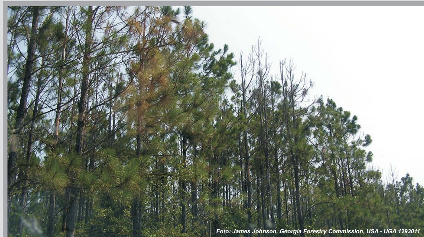
Fig. 1 - Disseccamenti su piante di pino in foresta causati da G. circinata

Nei paesi europei e mediterranei le specie più colpite sono il pino d'Aleppo ( Pinus halepensis ), il pino marittimo ( Pinus pinaster ) e il pino silvestre ( Pinus sylvestris ); tuttavia il patogeno è stato riscontrato anche su Pinus pinea , Pinus nigra , Pinus strobus , Pinus radiata , Pinus contorta e Pseudotsuga menziesii , sia in vivaio che in aree boschive.