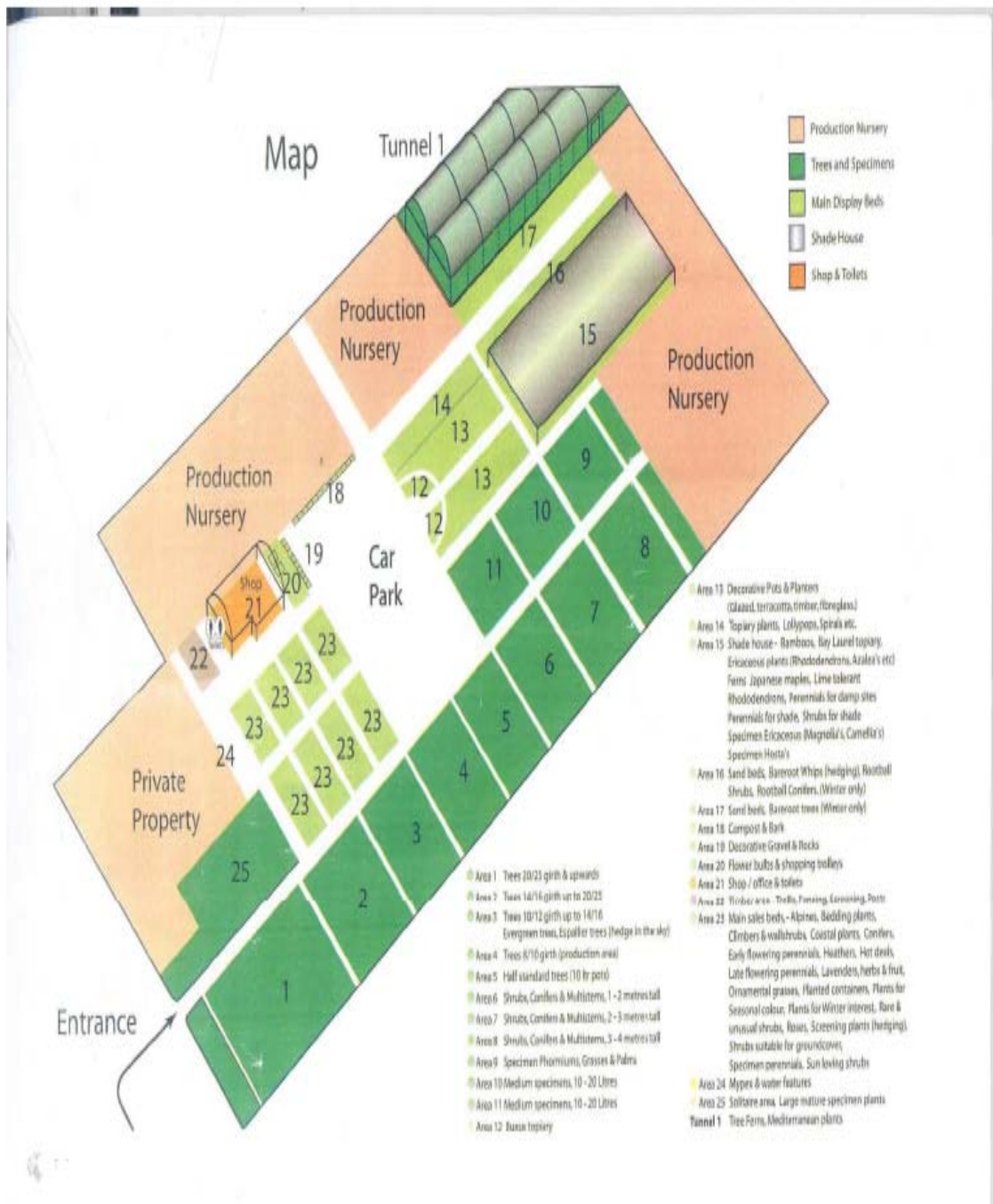
Fig. 1 esempio di mappa dell'azienda