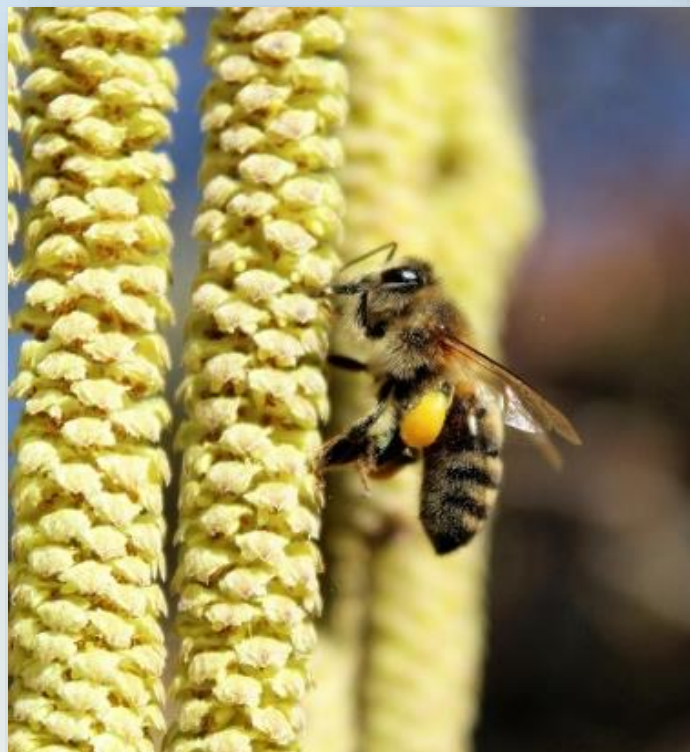
Ape su fiori di nocciolo

Se vogliamo aiutare ancora di più le api alla fine dell'inverno e all'inizio della primavera, mettiamo loro a disposizione piante arbustive a fioritura precoce come prugnolo , albicocco , ciliegio e caprifoglio invernale che forniscono un apprezzato mix di polline e nettare. Anche rosmarino e corniolo attirano le api grazie al loro nettare molto ricercato.