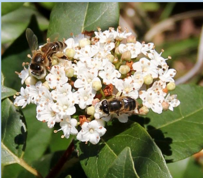
Ape e sirfide su viburno laurotino