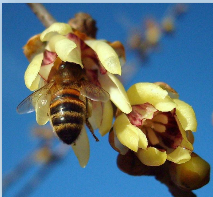
Ape su fiori di calicanto

Osservando attentamente è possibile vedere api volare all'aperto anche in pieno inverno, ovviamente nelle ore più calde della giornata. A fine gennaio le fioriture di nocciolo , viburno laurotino e calicanto attraggono le bottinatrici più temerarie e rappresentano un'importante integrazione alimentare per tutto l'alveare.