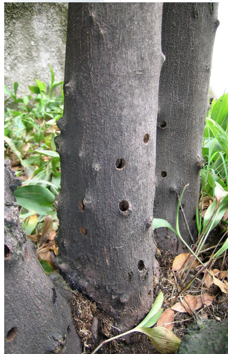
Fori di sfarfallamento di A.chinensis sul tronco