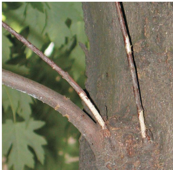
Scortecciature dei rametti

Gli adulti dei tarli asiatici sono facilmente riconoscibili per le grandi dimensioni (20-37mm) e per la caratteristica livrea nera picchiettata di bianco . Sono inoltre provvisti di antenne lunghe il doppio del corpo, composte da anellature nere alternate ad anellature chiare , e sono in grado di volare. Le due specie possono essere distinte sulla base degli organi attaccati: colletto e radici affioranti per A. chinensis , tronco e branche per A. glabripennis . Le piante attaccate dai tarli asiatici si riconoscono inoltre per i mucchietti di segatura e i grossi fori di sfarfallamento (8-15 mm di diametro) visibili sugli organi colpiti.