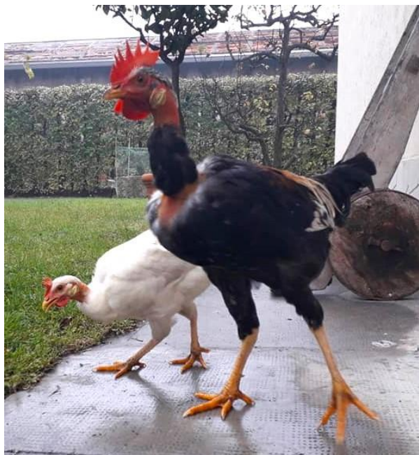
Nostrana Bolognese variante collo nudo