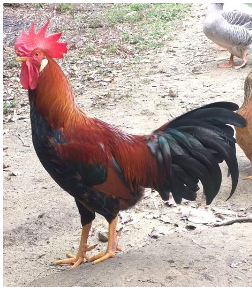
Nostrana Bolognese variante cinque dita