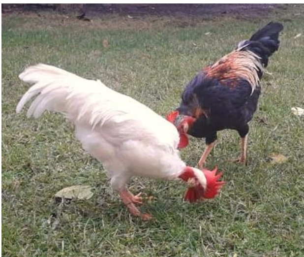
Nostrana Bolognese Variante collo nudo