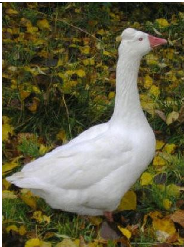
Romagnola con ciuffo