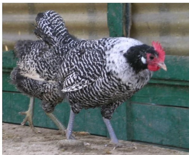
Moschettato argento testa di moro femmina