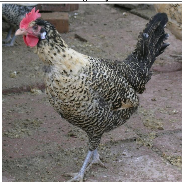
Moschettato limone testadi moro