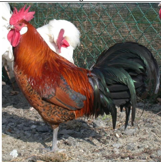
Moschettato oro maschio