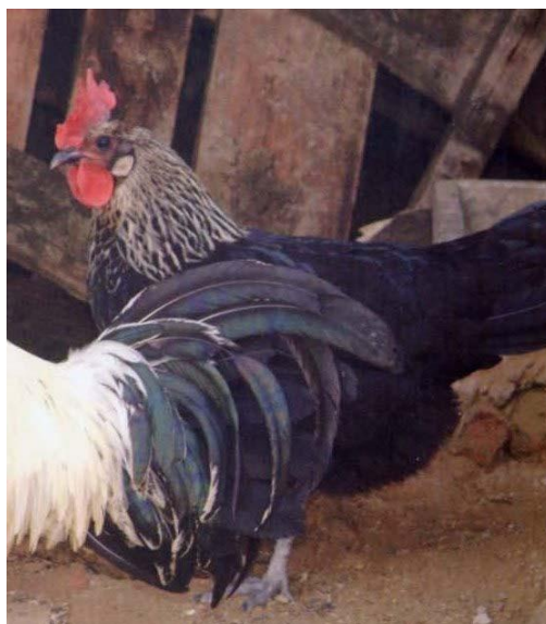
Betulla argento femmina