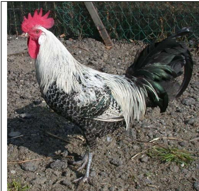
Moschettato argento maschio