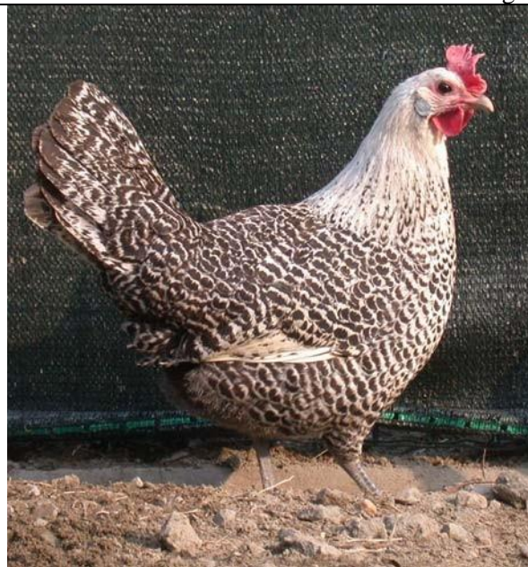
Moschettato argento femmina