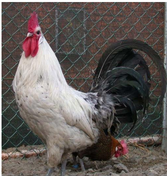
Fiocato argento maschio