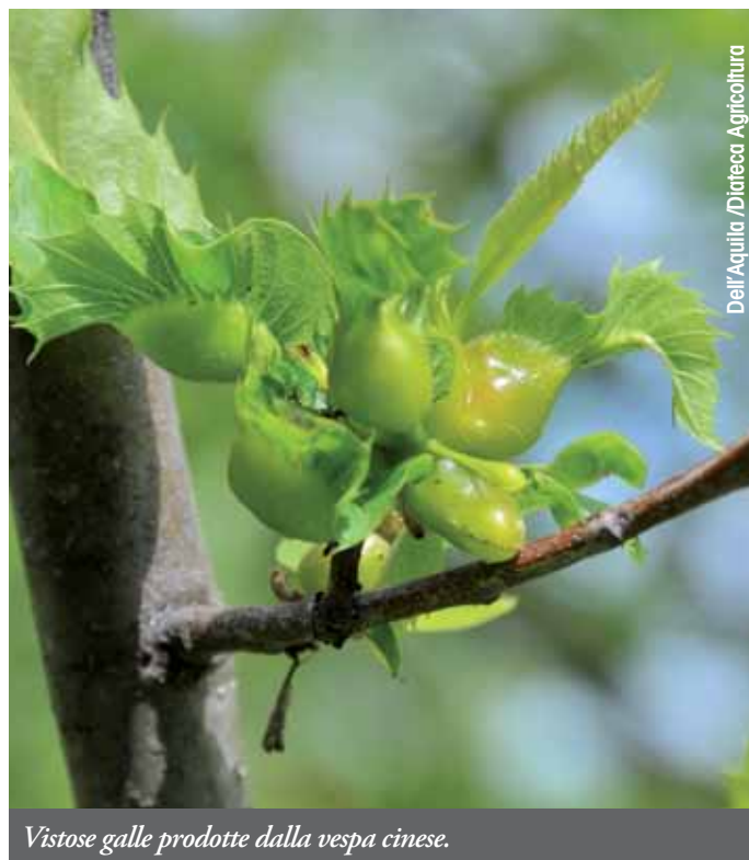
Vistose galle prodotte dalla vespa cinese.

Fino ad oggi le infestazioni del cinipide sul territorio nazionale non hanno determinato la morte dei castagni infestati. Tuttavia, in caso di forti attacchi, le piante manifestano riduzione dello sviluppo vegetativo, diradamento della chioma, calo della produzione di frutti e un generale deperimento che le rende più vulnerabili ad altre avversità biotiche e ambientali.