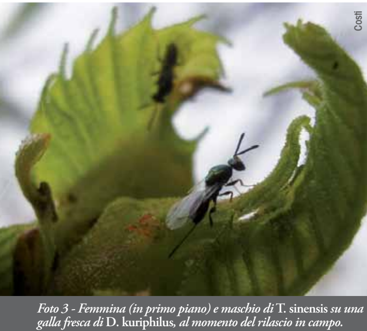
Foto 3 - Femmina (in primo piano) e maschio di T. sinensis su una galla fresca di D. kuriphilus, al momento del rilascio in campo.

ni di temperatura e umidità, all'aumentare del tempo di stazionamento in laboratorio incrementa la mortalità, con il risultato che al momento del rilascio in campo una certa percentuale dei parassitoidi ottenuti non era sopravvissuta (tabella 1).