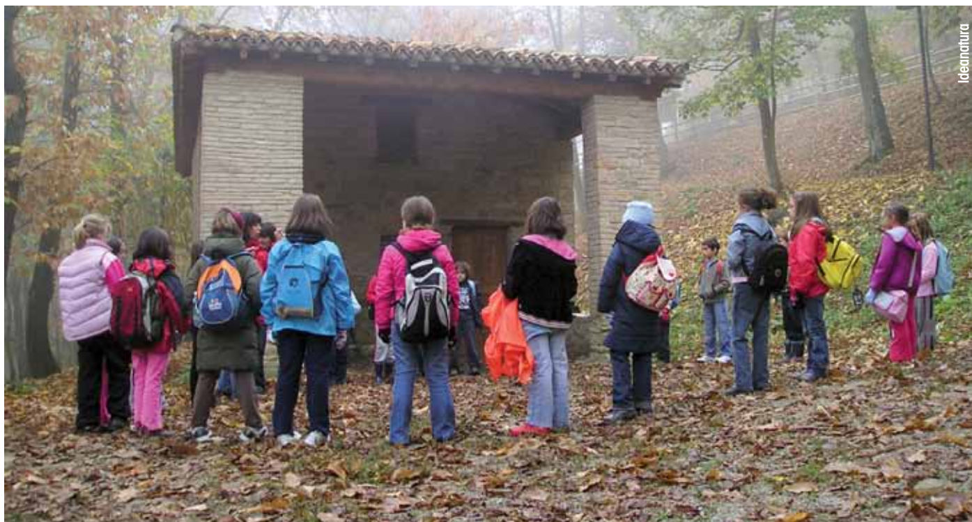
Una scolaresca in visita al metato didattico de "La Casa del Pan d'Albero" a Marola (RE).

La castagna può però costituire una fonte di diversificazione alimentare: si tratta infatti di un prodotto interessante per