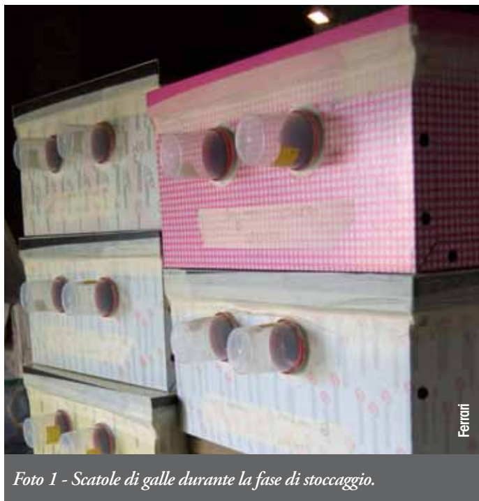
Foto 1 - Scatole di galle durante la fase di stoccaggio.

Nel corso di quest'anno allo scopo di verificare l'insediamento del parassitoide e, al contempo, disporre del maggior quantità possibile di materiale da introdurre in nuovi punti di lancio, si