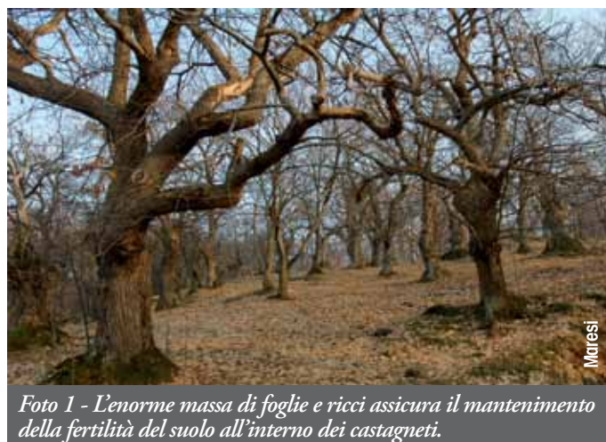
Foto 1 - L'enorme massa di foglie e ricci assicura il mantenimento della fertilità del suolo all'interno dei castagneti.

Usando materiale non preparato è molto probabile che l'innesto si presenti subito con galle che possono anche bloccare lo sviluppo dei getti. In questo caso è opportuno favorire inizialmente la crescita con una buona irrigazione e una concimazione organica, per poi procedere con potature verdi finalizzate sia a migliorare l'attecchimento della marza, sia a favorire la crescita di getti tardivi. Con la pota-