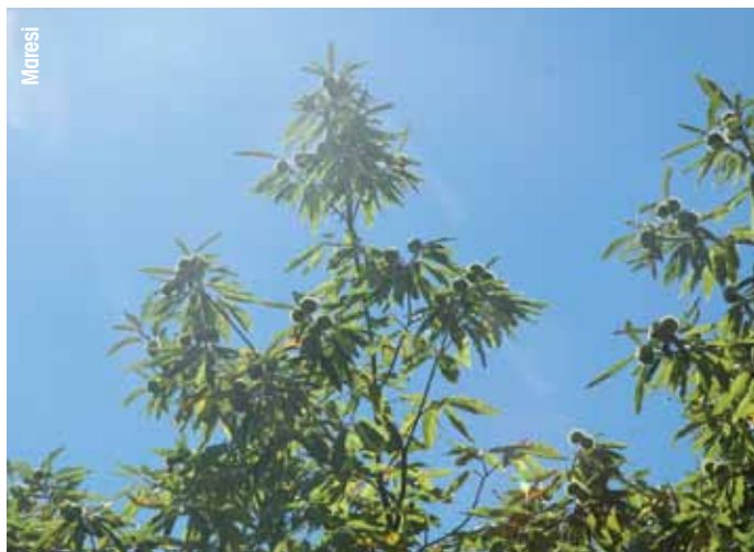
Foto 2 - La produzione di fiori e ricci è concentrata sui rami posti alla luce.

gli ottimi aspetti nutrizionali. È da sottolineare come il recupero abbia riguardato una minima parte dei castagneti da frutto presenti in Emilia, i soli marroneti, mentre i castagneti da farina mantengono quasi ovunque uno stato di abbandono che sembra ormai irreversibile.