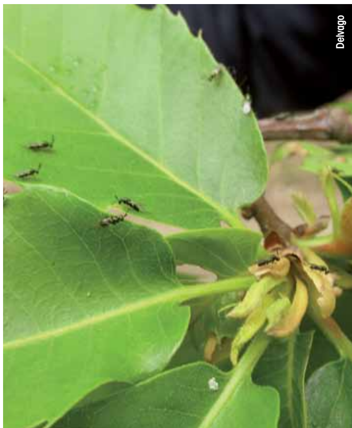
Esemplari di Torymus sinensis appena rilasciati in castagneto.