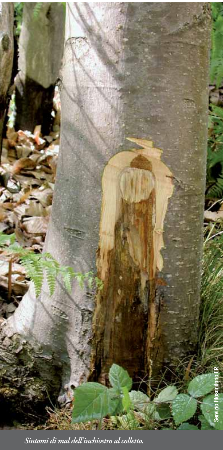
Sintomi di mal dell'inchiostro al colletto.