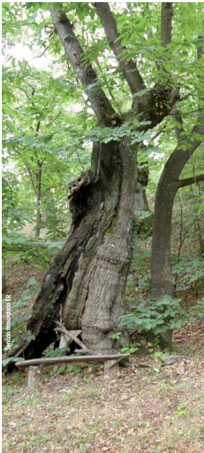
Servizio fitosanitario ER

possono identificare come soggetti dotati di strumenti programmatori e attuativi in grado di elaborare politiche di sostegno con un approccio integrato.