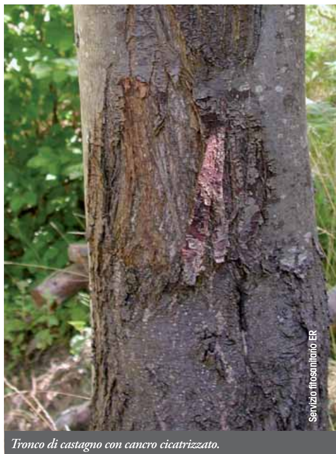
Tronco di castagno con cancro cicatrizzato.

Ricordiamo poi Phomopsis endogena , agente della mum-