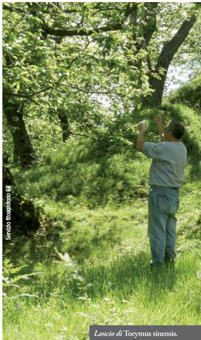
Servizio fitosanitario ER

• creare in Emilia-Romagna aree preferenziali nelle quali