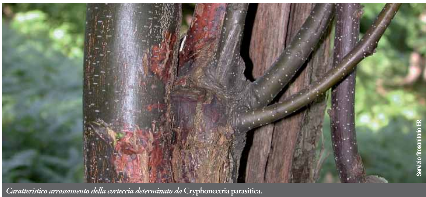
Caratteristico arrossamento della corteccia determinato da Cryphonectria parasitica .

X. dispar compie una sola generazione per anno e sverna nelle gallerie dei fusti dove le femmine hanno depresso le uova in primavera. Gli adulti fuoriescono da febbraio a maggio quando le temperature sono maggiori di 13-14 °C. L'afide giallo ( Myzocallis castanicola ) e l'afide nero ( Lachnus roboris ) sono facilmente rinvenibili il primo sulle foglie ed il secondo sui fusticini delle piante di castagno. Raramente la sottrazione di linfa che essi effettuano provoca ripercussioni sulla vita