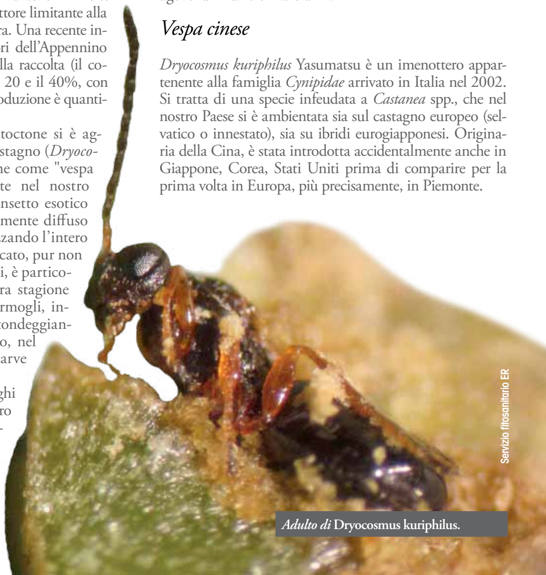
Adulto di Dryocosmus kuriphilus .

Dryocosmus kuriphilus Yasumatsu è un imenottero appartenente alla famiglia Cynipidae arrivato in Italia nel 2002. Si tratta di una specie infedele a Castanea spp., che nel nostro Paese si è ambientata sia sul castagno europeo (selvatico o innestato), sia su ibridi eurogiapponesi. Originaria della Cina, è stata introdotta accidentalmente anche in Giappone, Corea, Stati Uniti prima di comparire per la prima volta in Europa, più precisamente, in Piemonte.