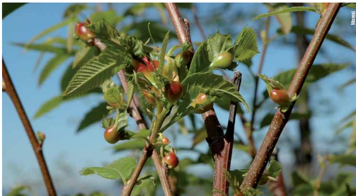
Foto 1 - L'impatto visivo degli attacchi del cinipide è spesso impressionante a primavera.