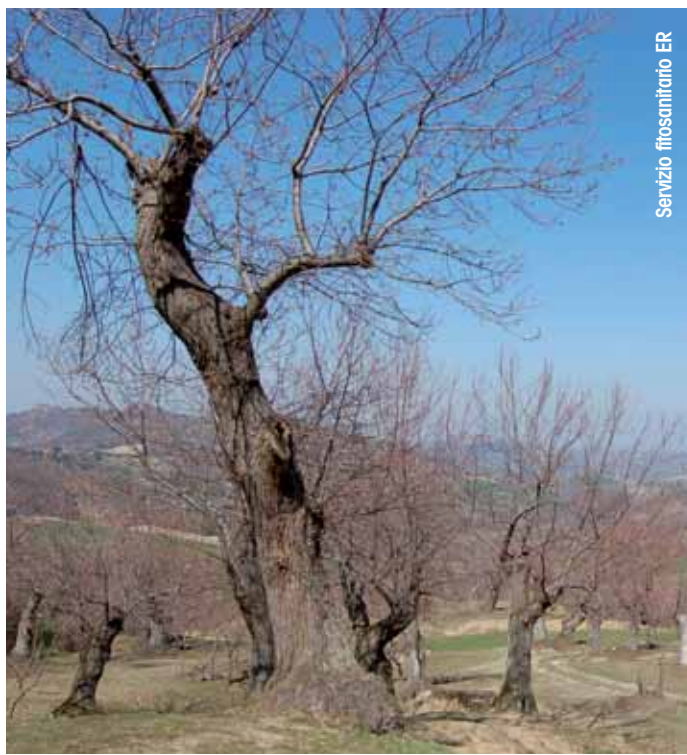
Servizio fitosanitario ER

Quando il micelio ha circondato tutto il ramo o il pollo-