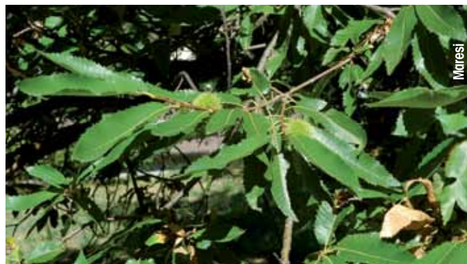
Foto 2 - Il buon sviluppo del getto può essere ottenuto con la concimazione, con le potature verdi o, come quest'anno, per le forti piogge primaverili.

Dove è possibile irrigare si può pertanto intervenire a primavera, a luglio e a fine agosto qualora la siccità e le alte temperature si ripetessero. Purtroppo per gran parte dei castagneti si può solo cercare di ridurre il disagio delle piante gestendo il suolo come