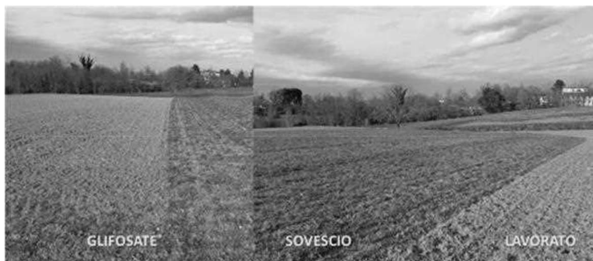
Fig. P1A1 Situazione della prova al 08-03-2023.