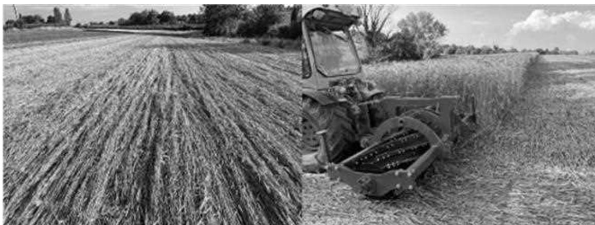
Fig. P2S4: Semina Girasole con macchina da sodo 11-06-2023.