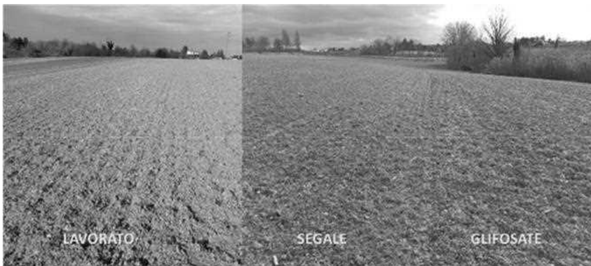
Fig. P2S1 7 Situazione della prova al 08-03-2023.