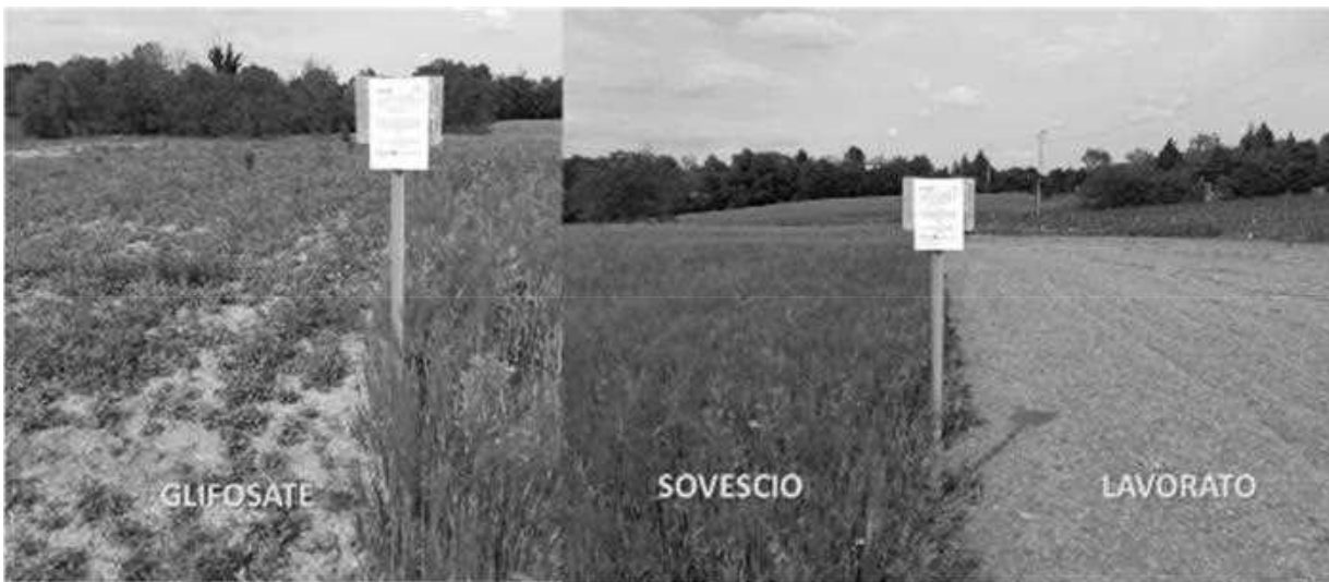
Fig. P1A3: Trinciatura del sovescio 08-06-2023.