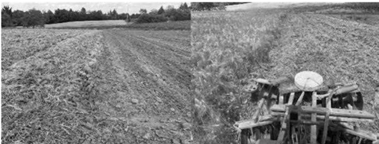
Fig. P1A4: Semina Girasole 11-06-2023.