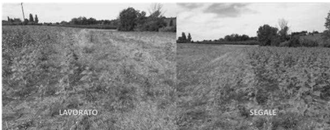
Fig. P2S5 Pre-Fioritura Girasole 01-08-2023.