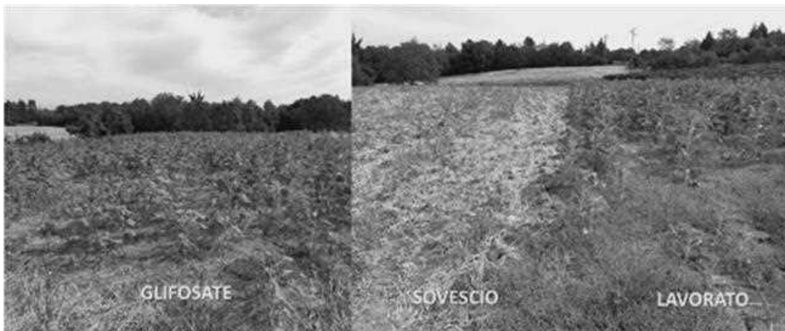
Tab P1A4.4 Risultati produttivi Girasole 29-03-2023: