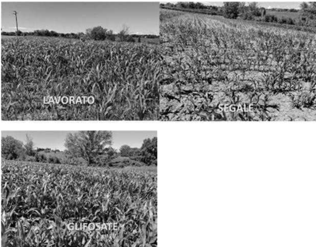
Fig. P2S7 Situazione della prova in sviluppo della segale 10-07-2024