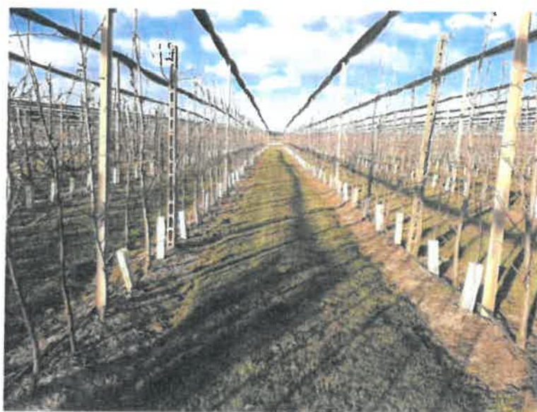
Esempio di cotico erboso correttamente sfalcio.

In sintesi, un'accortezza fondamentale resta quella di ridurre la quantità di materiale vegetale secco proveniente dal prato per ostacolare la moltiplicazione del fungo.