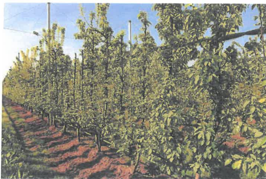
Esempio di corretta gestione del sottofila.