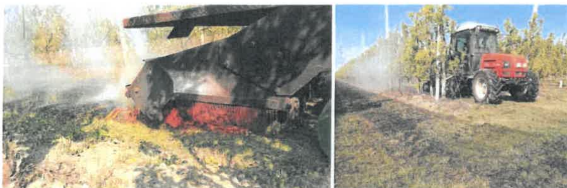
Esempio di trattamento termico con pirodiserbo su prato recentemente sfalcato.

La tecnica non è di facile applicazione e non si adatta a tutti gli impianti (possibili criticità rappresentate da ali gocciolanti o materiale infiammabile).