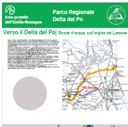
Pannello LATO 'A'