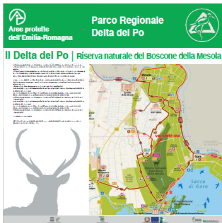
Pannello LATO 'A'

Allegato G - Fac-simile cartellonistica informativa da realizzarsi sulla base dell'immagine coordinata in corso di definizione da parte dell'Ente per la gestione dei parchi e delle aree protette – Delta del Po