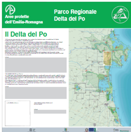
Pannello LATO 'B'