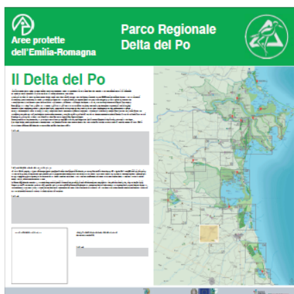
Pannello LATO 'B'