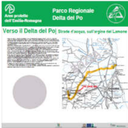
Pannello LATO 'A'