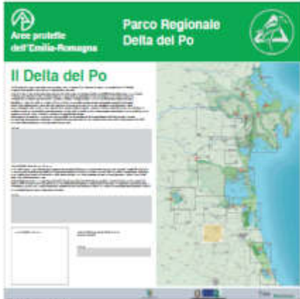
Pannello LATO 'B'