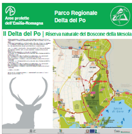
Pannello LATO "A"

Allegato F - Fac-simile cartellonistica informativa da realizzarsi sulla base del "Manuale di immagine coordinata nei comuni area Leader" definita da parte dell'Ente per la gestione dei parchi e delle aree protette – Delta del Po e scaricabile al seguente link: https://www.deltaduemila.net/sito/wp-content/uploads/2021/03/Cartellonistica-Coordinata-Leader.pdf