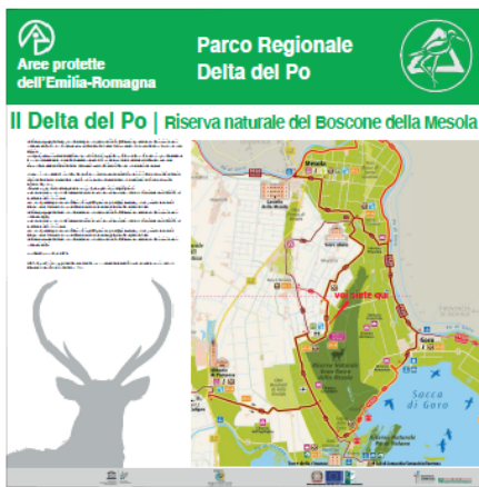
Pannello LATO "A"

Allegato E - Fac-simile cartellonistica informativa da realizzarsi sulla base del "Manuale di immagine coordinata nei comuni area Leader" definita da parte dell'Ente per la gestione dei parchi e delle aree protette – Delta del Po e scaricabile al seguente link: https://www.deltaduemila.net/sito/wp-content/uploads/2021/03/Cartellonistica-Coordinata-Leader.pdf