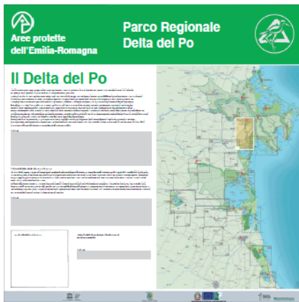
Pannello LATO "B"