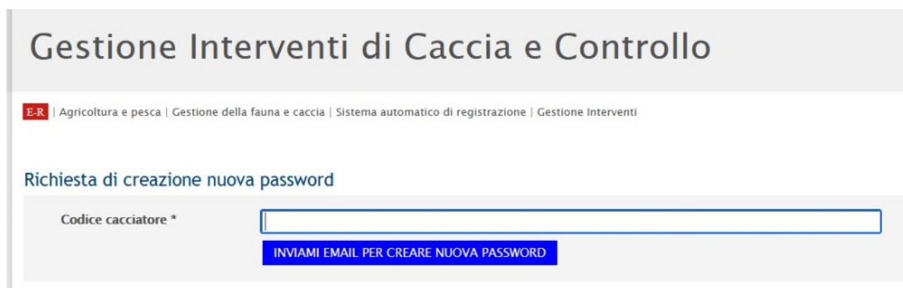
Figura 6: Richiesta creazione una nuova password

Inserisci poi il tuo codice cacciatore e premi il bottone INVIAMI e-mail PER CREARE NUOVA PASSWORD (Figura 6).