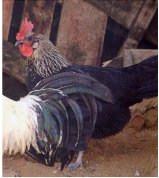
Betulla argento femmina