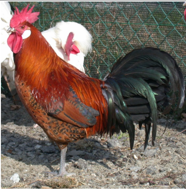
Moschettato oro maschio