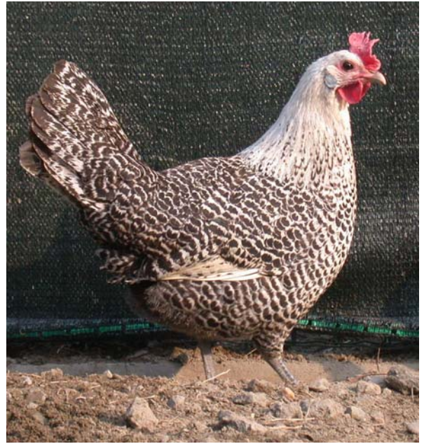
Moschettato argento femmina