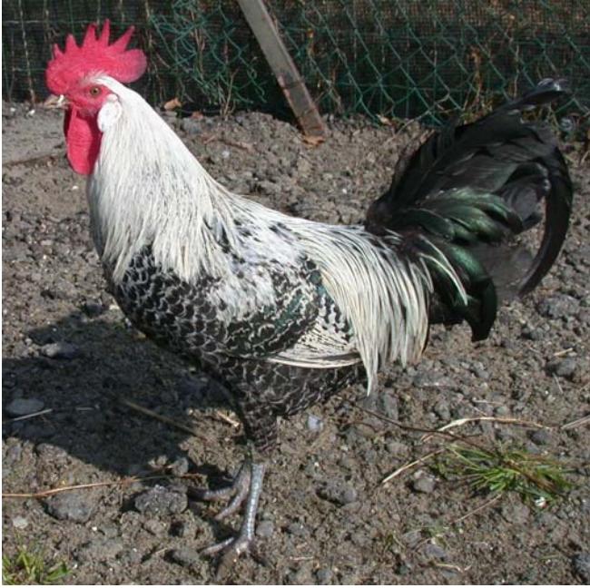
Moschettato argento maschio