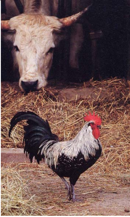
Betulla argento maschio