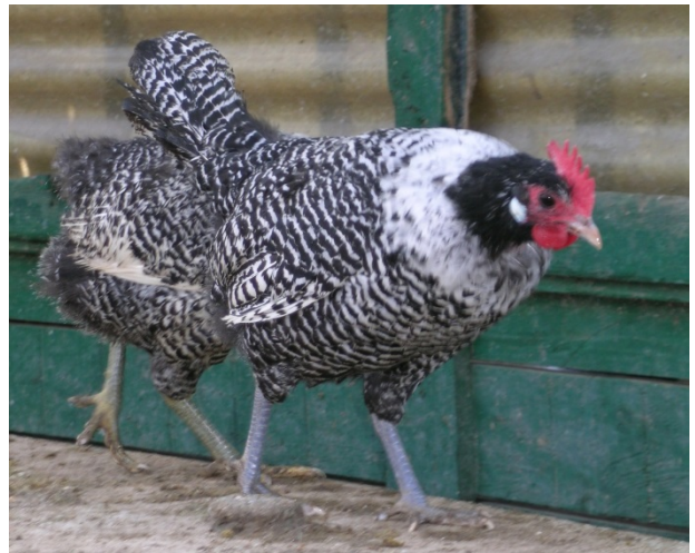
Moschettatoargento testa di moro femmina