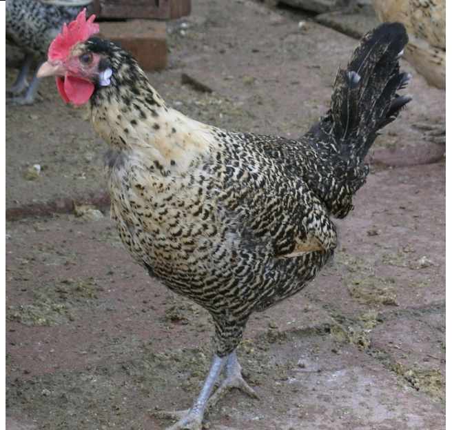
Moschettato limone testadi moro